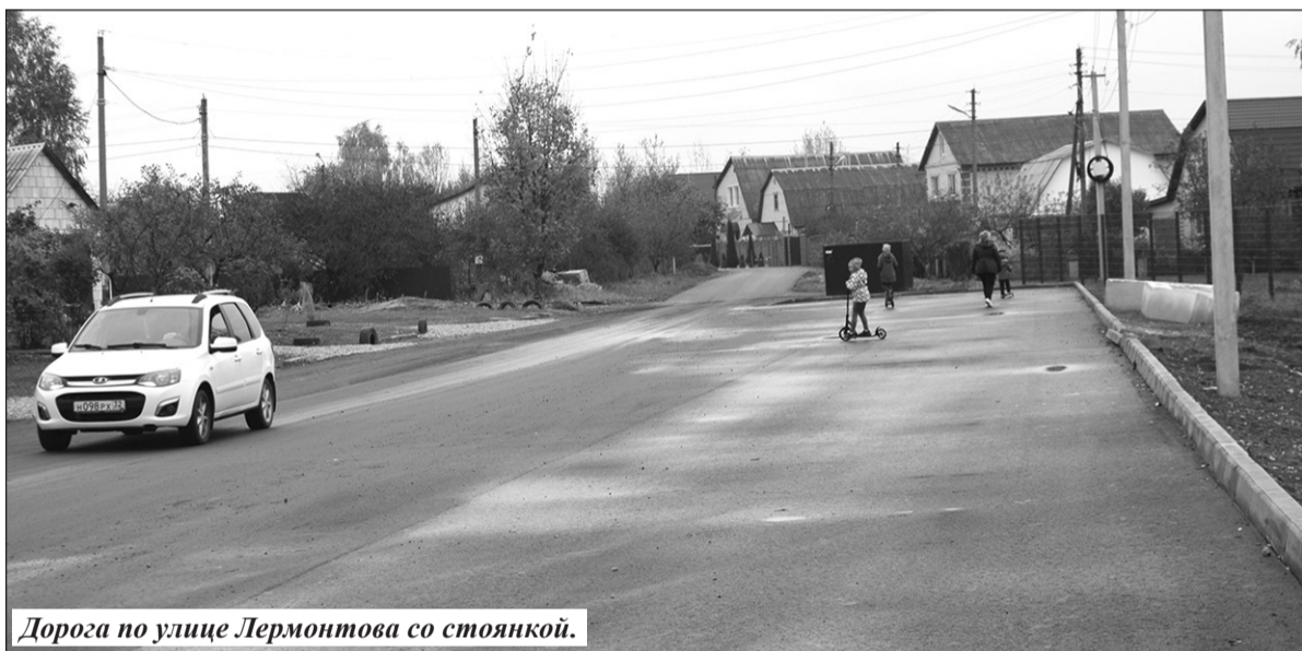
Дорога по улице Лермонтова со стоянкой.

а срок актуальности прошел и ее нужно перезаказывать по-новой. Нужно знать и соблюдать законодательство, но и не затягивать.