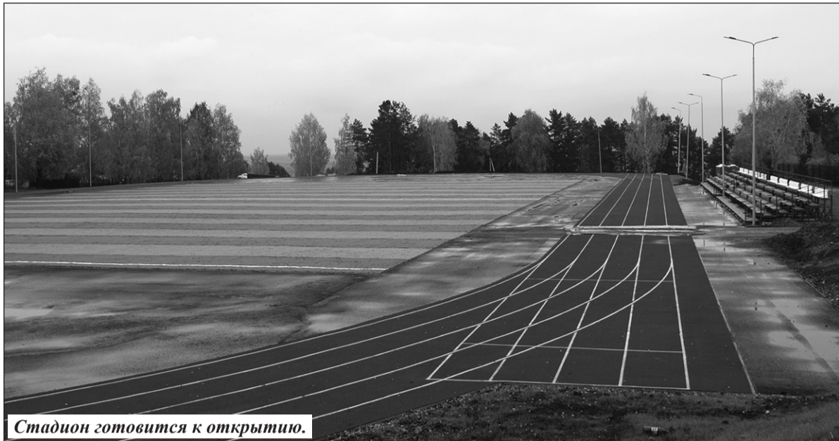
Стадион готовится к открытию.

– ПСД и надо готовить заранее, только, конечно, в разумных пределах, чтобы тоже не получилось, что на проект деньги потрачены,