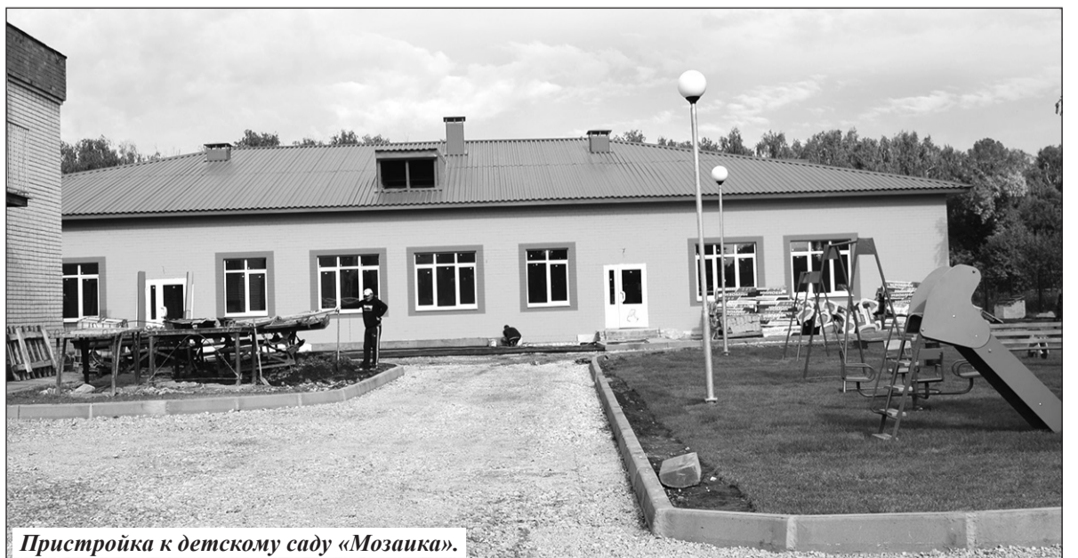
Пристройка к детскому саду «Мозаика».

Есть и еще одна приятная новость для многих жителей поселка Выгоничи. Нас ждет в следующем году ремонт нашей школы. Был звонок из департамента об-