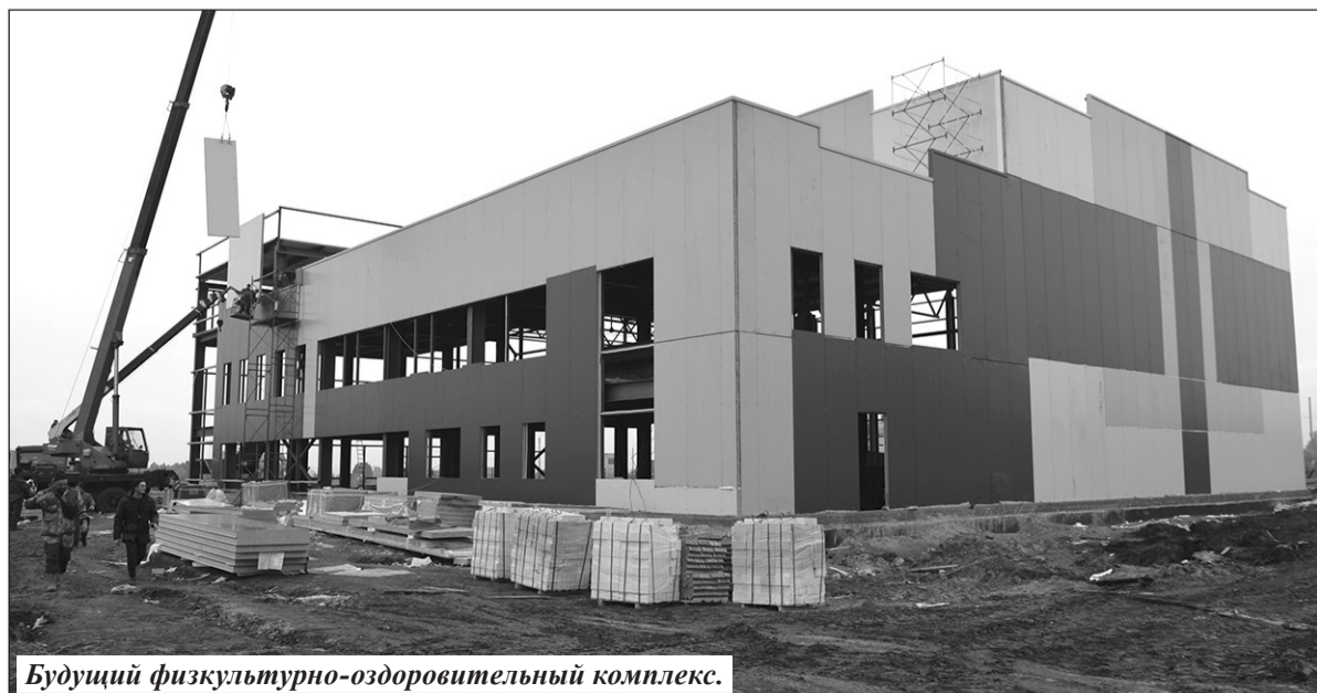
Будущий физкультурно-оздоровительный комплекс.