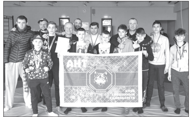
Подготовил Никита КОНЦЕВОЙ.

Теперь ребята представят Брянскую область на первенстве России по смешанным боевым единоборствам, которое пройдёт в Омске с 5 по 8 мая.