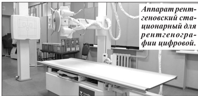
Аппарат рентгеновский стационарный для рентгенографии цифровой.

Еще одно приобретение минувшего года – универсальный УЗИ-аппарат. Хорошая модель – с увеличенным экраном, 4 датчиками.