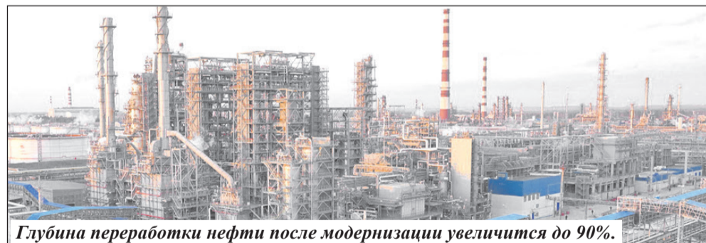
Глубина переработки нефти после модернизации увеличится до 90%.

За всю историю Мозырского НПЗ строительство комплекса гидрокрекинга тяжелых нефтяных остатков, который называют заводом в заводе, стало самым масштабным проектом в инвестиционном и производственном плане.