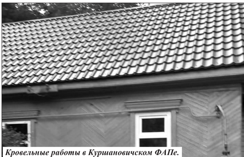
Кровельные работы в Куршановичском ФАПе.