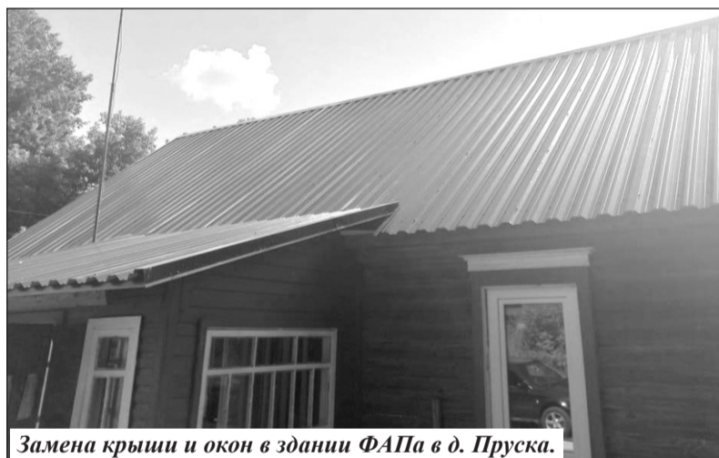
Замена крыши и окон в здании ФАПа в д. Пруска.

Долгосрочные результаты модернизации первичного звена здравоохранения в свете национального проекта «Здравоохранение» в целом мы увидим годы спустя, но уже сегодня нельзя не отметить темпы изменений, происходящих в первичном звене. Благодарность медицинских работников и пациентов – самый показательный критерий эффективности всех нововведений.