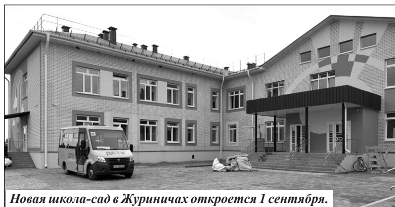
Новая школа-сад в Журиничках откроется 1 сентября.

Все образовательные организации Брянской области теперь уже подключены к высокоскоростному интернету, имеют возможности для ведения электронного профиля об-