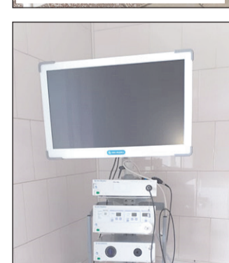
Эндоскопическая стойка с набором инструментов для полного объема лапароскопических операций с электромеханическим морцеллятором.