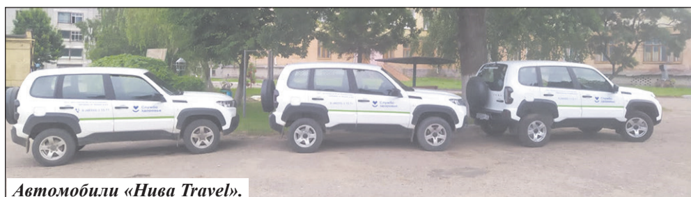
Автомобили «Нива Travel».