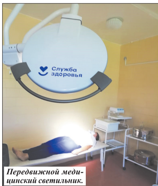
Передвижной медицинский светильник.

– Процесс дооснащения и оснащения оборудованием и автомобилями начался в 2021 году и продолжился в 2022-м. Капитальные же ремонты в рамках программы велись в подразделении районной больницы в прошлом году. В Старской врачебной амбулатории и