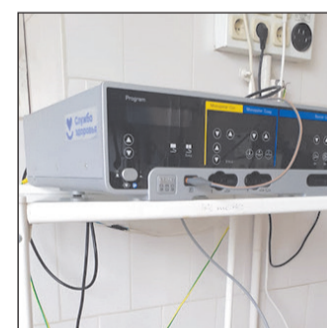
Хирургический моно- и биполярный электрокоагулятор с комплектом соответствующего инструментария в сочетании с электрохирургическими принадлежностями.