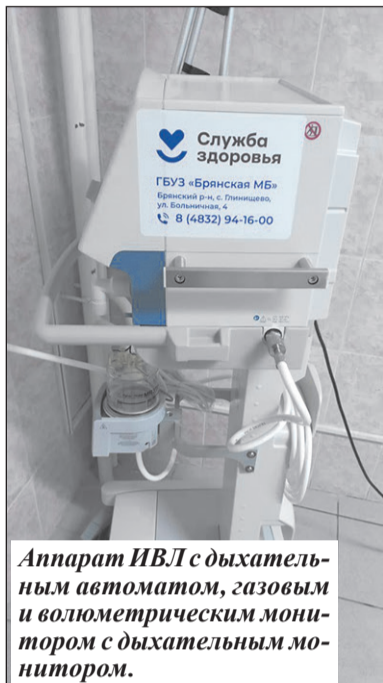
Аппарат ИВЛ с дыхательным автоматом, газовым и волюметрическим монитором с дыхательным монитором.

Брянская область не первый год активно задействована в проекте. Ка-