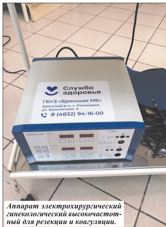
Аппарат электрохирургический гинекологический высокочастотный для резекции и коагуляции.

селение Брянского и Жирятинского районов, а это почти 70000 человек. Она имеет обширную сеть подразделений в сельской местности (37