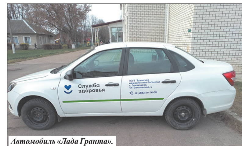
Автомобиль «Лада Гранта».