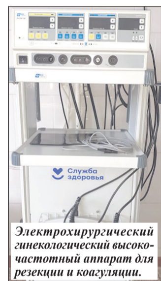
Электрохирургический гинекологический высокочастотный аппарат для резекции и коагуляции.

Программа «Модернизация первичного звена здравоохранения» национального проекта «Здравоохранение» позволяет каждому из участвующих в нем медучреждений делать шаги в сторону создания комфортных условий для пациента.