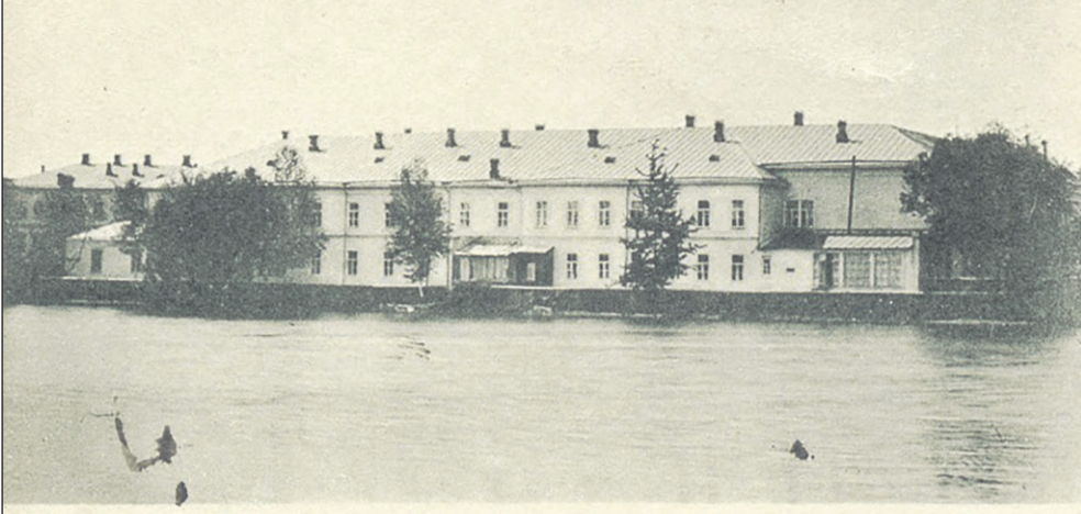
РЕАЛЬНОЕ УЧИЛИЩЕ СЪ ВИДОМЪ НА ОЗЕРО.

Новозыбковский педагогический колледж имеет богатую и интересную историю. В разное время в его стенах располагались 1-я Советская трудовая школа второй ступени, затем пединститут и педучилище. Названные образовательные организации являлись преемниками Новозыбковского реального училища, основанного в 1875 году для обучения мальчиков по техническим дисциплинам. Думаем, читателям будет интересно проследить историю становления и развития системы профессионального образования на Брянщине на примере данного учебного заведения.