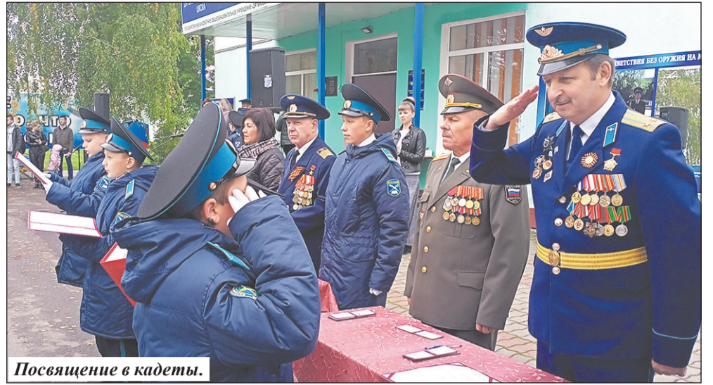
Посвящение в кадеты.

Большое внимание в учреждении уделяется профессиональной ориентации, которая призвана помочь воспитаннику правильно выбрать свой жизненный путь. Кадетское воспитание и образование строится на привитии с раннего возраста (обучение начинается с 5-го класса) чувства ответственности за свои поступки, ответственности за товарищей. Со школьной поры юноши привыкают к четкой организации своей деятельности. Получив первый документ об образовании, выпускники 9-го класса делают шаг к своей цели, выбирая, где продолжить обучение. Кто-то идет в 10-й класс муниципальных школ, поступает в профессиональные колледжи, а часть ребят продолжают обучение в стенах кадетской школы. Они готовятся к поступлению в различные вузы, но большинство решают связать свою судьбу со службой Родине.