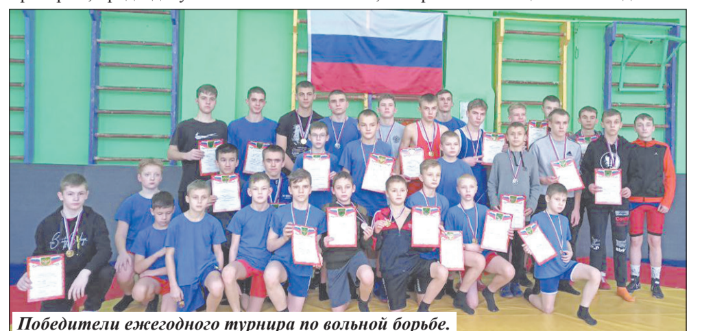
Победители ежегодного турнира по вольной борьбе.