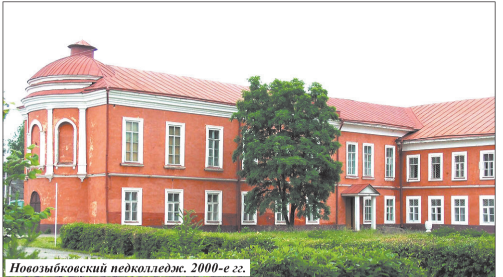
Новозыбковский педколледж. 2000-е гг.

В сентябре 1899 года директором училища назначат Николая Исаина. Это был высокообразованный, культурный человек с прогрессивными взглядами, активный сторонник развития земства и народного просвещения, педагог. Являлся членом городского училищного совета,