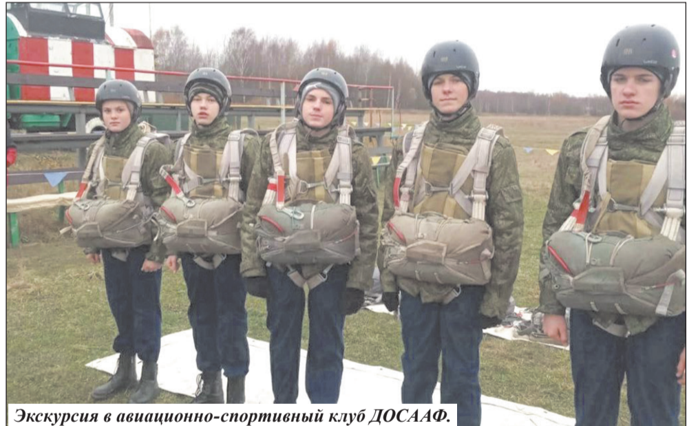
Экскурсия в авиационно-спортивный клуб ДОСААФ.