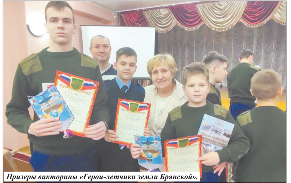
Призеры викторины «Герои-летчики земли Брянской».