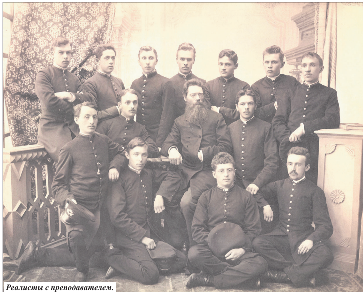
Реалисты с преподавателем.

В учебе и быту реалисты руководствовались Правилами, утвержденными министром народного просвещения в 1874 году. Основной целью обучения