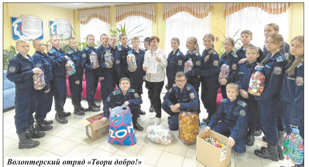
Волонтерский отряд «Твори добро!»

– Мы следим за судьбой наших выпускников. Рады всегда, когда они приезжают в школу, готовы помочь советом, а когда несколько лет тому назад нашему выпускнику понадобилась материальная помощь для лечения, то вся «кадетская семья» откликнулась: был организован благотворительный концерт. Наши выпускники разбросаны