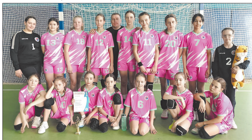
Фото Дворца единоборств.

лось попасть в тройку призеров, но на данный момент это закономерный результат, наш уровень. Надо становиться сильнее. Но главное, что удалось увидеть в деле наших новеньких и тех, кто раньше получал мало игровой практики. Несколько девочек забили свои первые голы в карьере. Кто-то вообще поехал первый раз на соревнования. А есть и те, которые раскрылись и стали одними из лидеров команды.